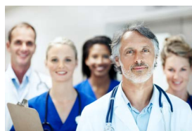
Equipo de especialistas